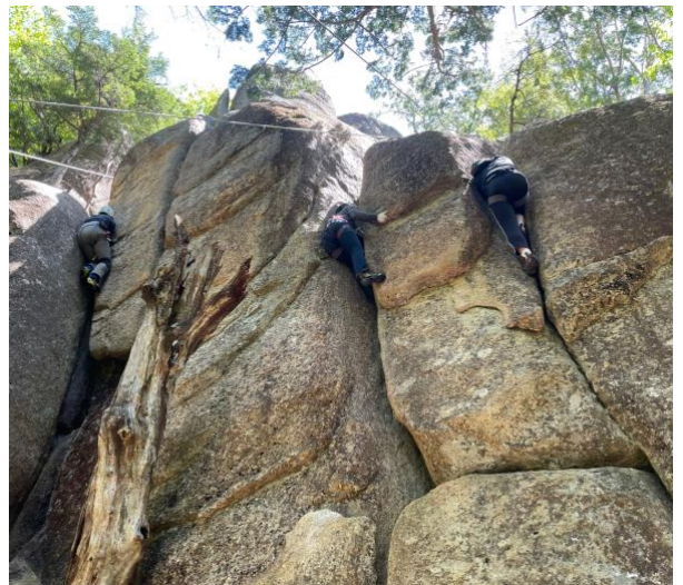
6月4日 アルパインクラブ例会山行 クラッククライミング@瑞牆山