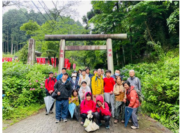
6月11日 交流ハイキング 大平山